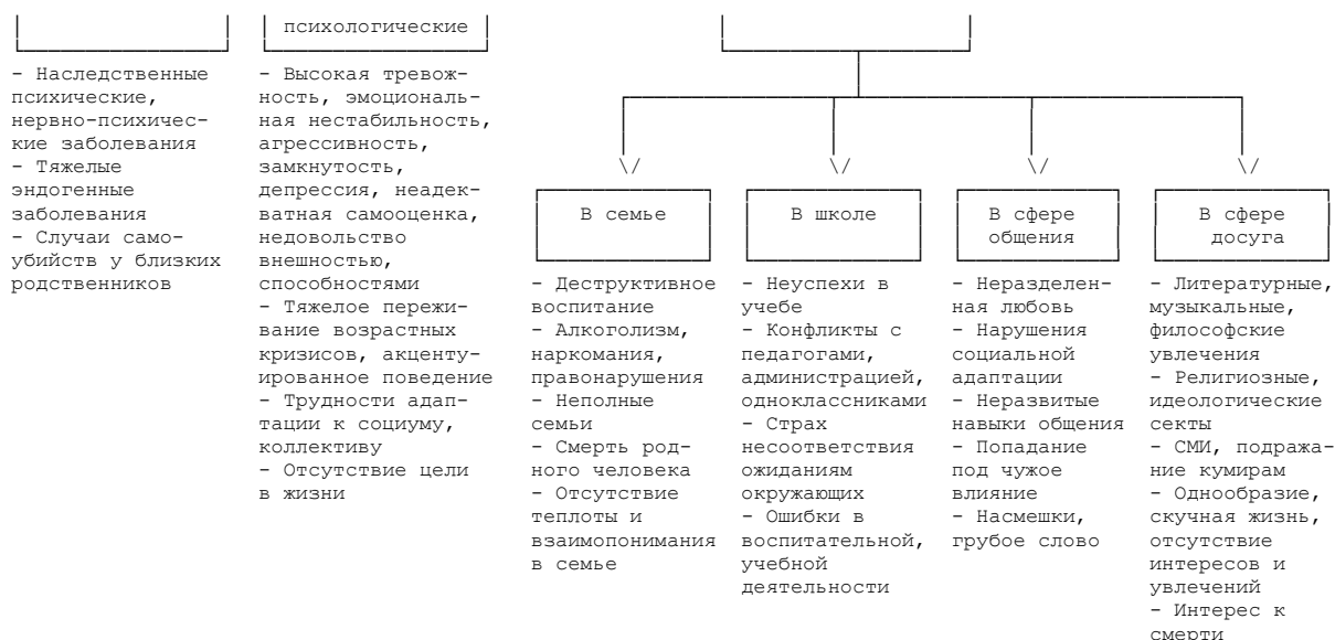
Рис. 1. Факторы суицидального риска

Группы суицидального риска - это подростки: